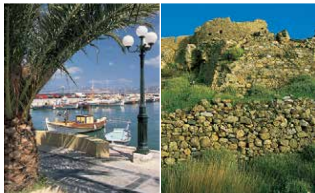
מימין מבצר בפליאוחורה משמאל נמל סיטיה

אף שהמחברים, ספקי תוכן אחרים, דורלינג קינדרסלי ושטיינהרט שרב נהנו בהקפדה סבירה בהכנת ספר זה, אין זה ערבים לכוונתו או לשלמותו של המידע בספר, ואין הם מקבלים על עצמם, במידת האפשר, כל חבות הנובעת מהשימוש בו.