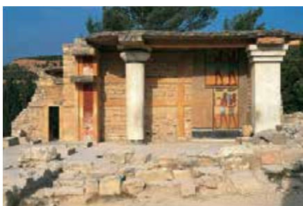
הפרולון הדרומי בקנוסוס

היינריך שלימן היה זה שהצביע על קנוסוס כאתר ארכיאולוגי מן המעלה הראשונה, אך דווקא הארכיאולוג הבריטי ארתור אוונס הוא שחפר את האתר, בעשרים הראשונים של המאה העשרים. העמודים, החצרות וציורי הקיר הססגוניים של הארמון המינואי העתיק מעוררים התפעלות גם היום. קנוסוס חרבה בהתפרצות געשית אדירה, שמוטטה את התרבות המינואית כולה, אך כיום האתר הוא אחד השרידים המרשימים ביותר מעולמם האבוד של המינואים (ראו עמ' 8-11).