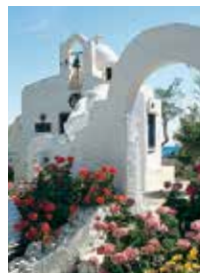
שער כרתי מסורתי בֶּרְסוֹנוֹסִיוֹס