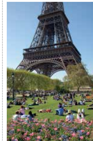
מגדל אייפל מתנוסס מעל שאן־דה־מארס, פאריז