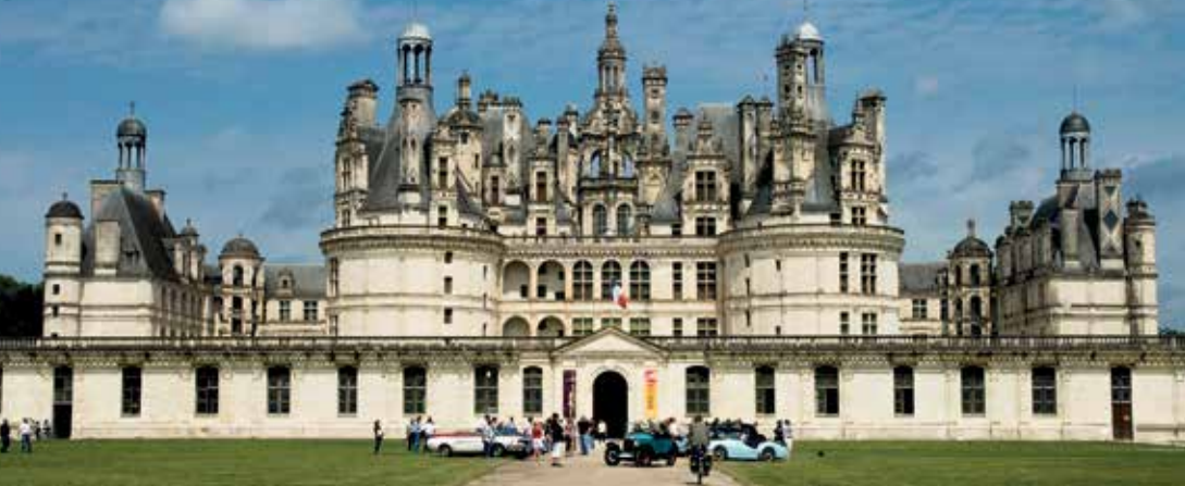
החזית המרהיבה של שאטו דֶה שאמבור, הטירה הענקית מתקופת הרנסאנס בעמק הלואר