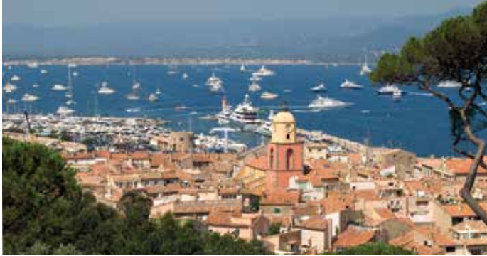
תצפית על העיר סֶן־טרוֹפֶה ועל המפרץ שלה, קוט ד'אזור