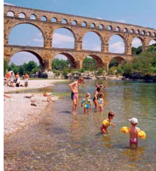
למעלה משתכשכים בנהר מתחת לפון דו גאר למטה בתי קפה בכיכר טרן, ליון

(עמ' 302–3) הן מקומות נפלאים למשפחות, ומכולן יש גישה קלה לחופים. מבין מיטב הערים הקטנות יותר, מומלצות במיוחד בירות היין של חבל בורגון, בון (עמ' 202) ו נים (עמ' 336), היא רומא של צרפת! בסטראסבור (עמ' 57) יש אינספור אתרים מרתקים, בהם הקתדרלה והפרלמנט האירופי, וכך גם בעיר העשירה בורדו (עמ' 186–7), שנבנתה בימי־הביניים, ו בדיזון (עמ' 200–1). רואן (עמ' 144–5) מהלכת קסם בבניינה התיקים עם קורות־העץ החשופות בנוסח ימי הביניים ובקתדרלה שצייר מוֹנֶה. גם בעמק הלואר יש מקבץ מרשים של ערים עתיקות, כמו טור (עמ' 180–1), שינון (עמ' 182), לה מאן (עמ' 179), ו סומור (עמ' 178).