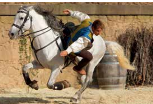
משמאל המופע בגראן פארק פואי דה פו למטה הקשת הטבעית בחוף של חלוקי־האבן באֶנְזֶה, נורמאנדי

ב פוטורוסקופ (עמ' 282–3) מחכה לכם חווית ההייטק האולטימטיבית: תוכלו לקפוץ לביקור בעתיד, ואפילו בממד הרביעי. ב גראן פארק פואי דו פו (עמ' 177) אין כלל מתקני שעשועים, אבל מציעים בו התנסות חוויתית בתקופות היסטוריות שונות; משפחות יכולות אפילו ללון בכפר מימי הביניים, בבקתה הבנויה על כלונסאות בתוך אגם. טרה בוטאניקה באֶנְזֶה (עמ' 179) הוא פארק השעשועים הבוטאני הראשון בעולם. המוצלחים שבגני החיות והפארקים שמפגש עם חיות הוא חלק מחווית הביקור בהם, הם פארק דה לה קוקסינל הסמוך לבורדו (עמ' 295), שתוכנן במיוחד לילדים עד גיל 12, ובנוסף למתקני שעשועים יש בו גם פינות לטיוף; וכן לה רֶקֶרֶה דה טרֶאֶה קוֹרֶה בבֶרְסֶט (עמ' 163), שיש בו גם פארק־מים ענקי.