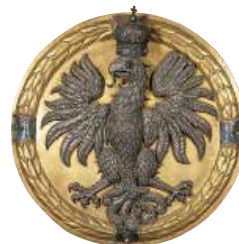
העיט, סמלה של מלין, בקפלת זיגמונט, קרקוב