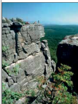
עמק קלודז'ק, גן-עדן טבעי למטיילים

• ורצללב העתיקה • חיפוש זהב בזואוטוריה • מקום מפלט בעמק קלודז'ק ורצללב (ראו עמ' 97-188), העיר העתיקה והתוססת, היא ביתם של כמה מהאמנים בני-זמננו המעניינים ביותר במדינה. זואוטוריה (ראו עמ' 180) נמצאת לגדות של נהר קאצ'אן והעשיר בזהב. נוס את מזלכם בחיפוש זהב ולאחר מכן בקרו במוזיאון הזהב, או צפו במשתתפים בחחרות הבינלאומית של סינון הזהב. לרוחבו ולאורכו של עמק קלודז'ק המרהיב (ראו עמ' 200-1) עוברים מסלולי הליכה, רצופים כנסיות ומבצרים, והאזור מפורסם במעינות החמים שבו.