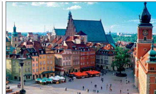
הכיכר הציווית בבלה של העיר העתיקה בורשה

ועתירה דוגמאות רבות ויפות לאדריכלות בסגנונות הגותי והרנסאנס. על העיר העתיקה משקיפים הבניינים המפוארים הניצבים בגבעת ואגל (ראו עמ' 43-138), סמל לעוצמה ולפטריוטיזם הלאומי. במסגרת הפסטיבל השנתי לתרבות היהודית (ראו עמ' 33) מתקיימים מופעי מוסיקה ומגוון של אירועי אמנות והצגות תיאטרון.