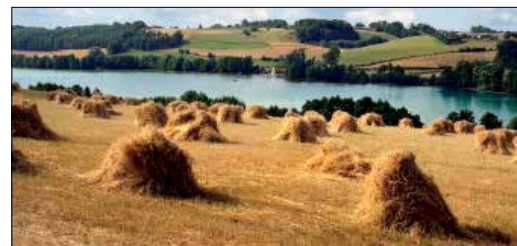
הנוף השליו של אזור קאשוב'ה בפומראניה

• לוד' התעשייתית • הכנסיות היפות בפוזנאן • מצודת קריניץ של האי את העיר התעשייתית לוד' (ראו עמ' 9-228) ייסדו במאה ה-19 שלושה בעלי מפעלים, ויש בה מוזיאונים מרתקים רבים ואווירה נעימה, שלא נמגמה כמעט מהתיירות אליה. הכנסיות בפוזנאן (ראו עמ' 19-214) הן מהיפות ביותר בפולין. הקתדרלה בסגנון הגותי היא העתיקה ביותר במדינה, וסוברים שהמלך הראשון של פולין הוטבל כאן. ותכולו לצאת