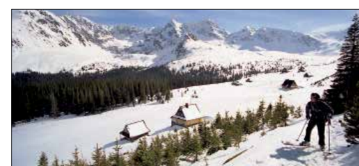
אתר הסקי בזאקופאנה, ששופץ לאולימפיאדת החורף של 2006

• עברה העגום של פולין • מכרה המלח וייליצ'קה • ספורט חורף בזאקופאנה מחנה ההשמדה אושוויץ בעיר אושביצ'ים (ראו עמ' 160), בו הושמדו כ-1.1 מיליון יהודים בידי הנאצים, ניצב כעדות לשואת יהודי אירופה וכיום נכלל ברישימת מורשת העולם של אונסק"ו והוזהו יעד ראשון במעלה ליהודים בכל העולם. בעיירה וייליצ'קה (ראו עמ' 162) נמצא מכרה המלח התת-קרקעי הישן, ובו קפלה, מוזיאון ומסעדה, ואילו זאקופאנה (ראו עמ' 164), בירת החורף של פולין, היתה מקום מפלט אהוב על אמנים ואינטלקטואלים במקנה המאה ה-20, ומדי חורף מבקרים כאן אלפי גולשי סקי.