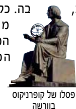
פסלו של קופרניקוס בורשה

פולין, השוכנת בין מזרח למערב, מתפארת בהיסטוריה עשירה ובמיזוג מעניין וייחודי של ישן וחדש, הניכר בה כיום. במדרין זה מחולקת פולין לתשעה אזורים, המסומנים בצבעים שונים ומשקפים את הגיוון הרב