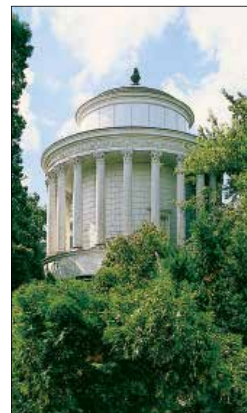
רטנונה בסגנון ניאוקלאסי בגנים האקסונויים, ורשה