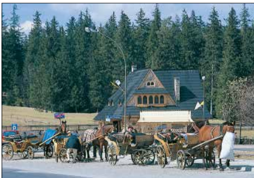
כרכרות רתומות לסוסים בזאקופאנה