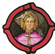
דיוקן בוויטראז' של אנייס סוֹרְל