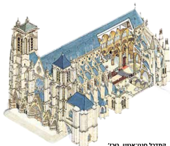
קתדרל סנט־אֶטיֵין, בורז'