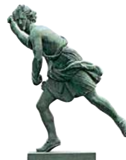
פסל בלה לורי