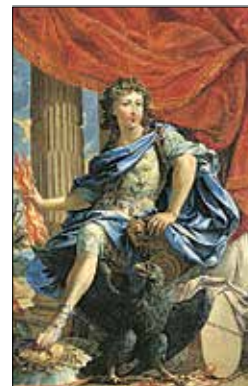
המלך לואי ה־14 מצויר כזאוס, כובש את לה פרונד