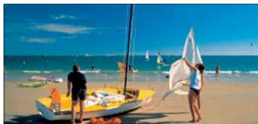
חוף לה בול בלואר-אטלנטיק

באזור הביצות הנמוך מאָה פּוֹאָטבאן (ראו עמ' 5-182) השווי במאבק מתמיד נגד פלישת מי הים, יש מגוון ביולוגי עשיר ושפע של בעלי חיים. הדרך הטור בה ביותר לטייל בשטח הביצות, שנקרא 'ניז' ור', היא בבארק (barque), סירה מסורתית שתחיתיה שטוחה. חתרו דרך המבוכ המימי, שמצדדיו ניטעות ערבות בוכיות, ועצרו לנוח באחד הנמי לים היפים שבדרך. גולשים נוהרים אל קו החוף של ואנדה בכות הגלים הרועמים והחופים הגדולים והחוליים.