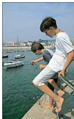
ילדים דגים במרינה של פורנישה בלואר־אטלנטיק