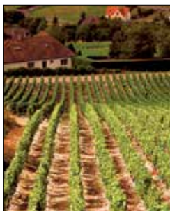
הכרמים רחבי הידיים המקיפים את סאנסר

למרבה ההפתעה, האזור הכפרי לא מוצף בתיירים. בירתו בורג' (ראו עמ' 53-150), שבה ניצבת קתדרלה מרשימה, היא פנינה אדריכלית. היפה ביותר מבין שלל הבניינים העתיקים היפהפיים מימי הביניים של העיר, הוא ארמון ז'אק קר.