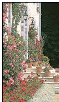
מְנוּאֶר דוֹ גְרָאן מְרִטִיני