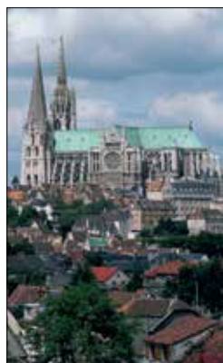
הקתדרלה הגותית נוטרדאם, בשארטר

פניו של האזור פונים אל האוקיינוס האטלנטי הסוער, ובגבו נמצאות טירותיו של הלואר. בעבר היתה נאנט (ראו