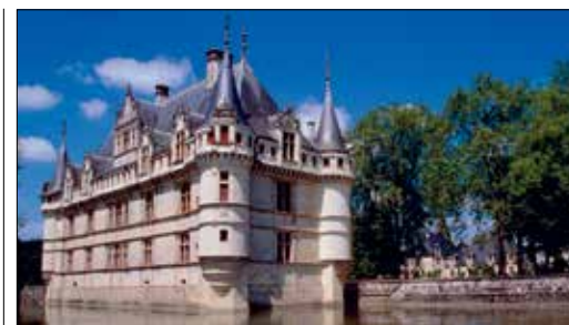
שאטו דה אָה־לה־רידו

מן, בירתה של אימפריה אדירה. הטירה העצומה המתנשאת מעל לכרך המודרני השוקק של היום, המלא תרבות ופעילות, מהווה ניגוד מעניין.