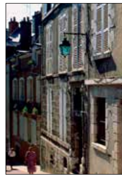
רחוב שקט בעיר בלזאָה מימי הביניים

בימי הביניים היו בלזאָה (ראו עמ' 124-7) ו אורליאַן מרכזי שלטון רבי עוצמה. כיום הן ערים שוקקות, וברבעיהן העתיקים יש מוקדי עניין רבים למטיילים. אורליאַן נבנתה מחדש לאחר שספגה פגיעות במהלך מלחמת