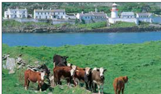
פרות רעותה בספניש פוינט (Spanish Point) ליד מִיִּזֶן אֵד (עמ' 167)