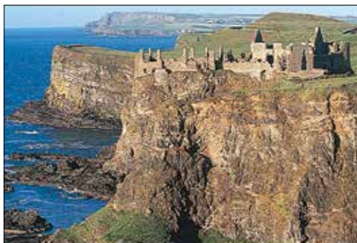
שרידיה המתפוררים של טירת דאנלוס שבצפון אירלנד

צפון-מערב אירלנד היה תמיד חבל ארץ מבודד ומנותק. היום חיים בו דוברי אירית רבים. בולטים בנופיו הסוערים צוקי סליב ליג (עמ' 229), ששעתם היפה היא לעת שקיעה, כאשר הצוקים מופזים באור ארגמני. עדר הצבאים הגדול הוא סיבה מספקת לבקר בפארק הלאומי ובטירה של גלנבי (עמ' 216-17), אך אם לא די לכם בכך, תוכלו ליהנות כאן גם מלוך וי המדחים, ומהעמק המורעל המפחיד והמסתורי.