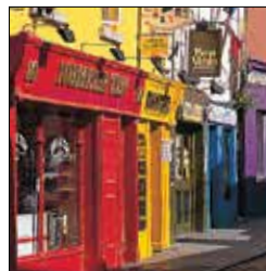
חזיתות חנויות ססגוניות במרכז גולווי שבמערב אירלנד

בפארק הלאומי של קונמארה (עמ' 208) שוכנות ארבע מתריסר הפסגות – שרשרת הרים המתנשאת מעל מישורי