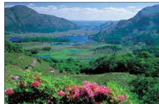
אגמי קילארני שבמחוז קרי, טובלים בירוק עז