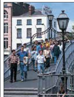
עוברי-אורח על גשר האפני שמעל נהר ליפי בדבלין

דבלין היא עיר קומפקטית, שרוב אתריה נמצאים במרחק הליכה קצר זה מזה. בשנים האחרונות הפכה העיר קוסמופוליטית יותר, ויש בה מבחר עשיר של פיתויים לתיירים. בטרניטי קולג', שהוקם ב-1592 על-ידי המלכה אליזבת הראשונה, נמצאת הספרייה העתיקה המרשימה, ובה כתבי-יד מימי הביניים כמו 'כתב-היד של קל' (עמ' 64-62). במוזיאון הלאומי (עמ' 66-67), הסמוך לקולג', תוכלו ללמוד על עברה המרתקת של אירלנד, ואילו בגלריה הלאומית (עמ' 71-70) יש מוצגים נפלאים, במיוחד באגף המילניום. בדבלין יש תאטרון מעולה ומחזות של גדולי המחזאים של אירלנד מוצגים בתאטרונות כמו האג'י (עמ' 88), שייסד המשורר ייטס. ברובע סמפל בר השוקק (עמ' 78) תוכלו לבלות בפאבים