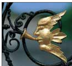
פרט משער המקהלה בבית פאָורסקורט (עמ' 35-134)