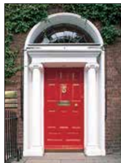
דלת ג'ורג'יאנית בכיכר פיצוויליאם שבדבלין (עמ' 68)