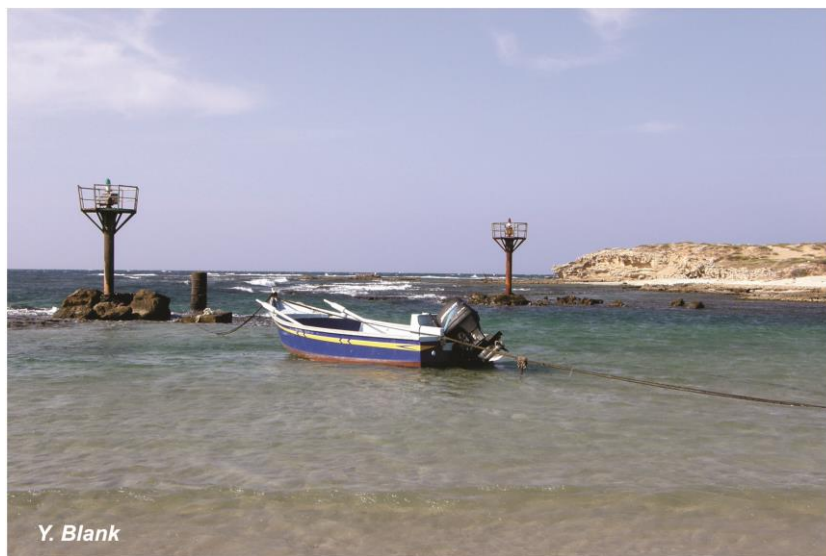
חוף הדייגים גי'סר א-זוקא

של שכונת וייצמן. חוצים מעל מסילת הרכבת על הגשר (20, 24.0), פונים בחדות ימינה ומגיעים לתחנת הרכבת של חדרה (25, 24.9).