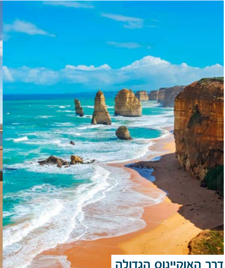
דרך האוקיינוס הגדולה

זוהי העיר השנייה שנוסדה באוסטרליה, ואולי היפה מכולן. תרבות האיים המייחדת את הובארט (Hobart; עמ' 179) זכתה לאחרונה לחיזוק מהזירות המשגשגות של אוכל ואמנות, שאותן מוביל המוזיאון לאמנות עתיקה וחדשה - מתחם חדשני ברמה בינלאומית, שבעליו מגדיר אותו כ"דיסנילנד חתרני למבוגרים". אבל אווירת ימים עברו שאפיינה את הובארט לא נעלמה: סלמנקה פלייס ובאקרי פוינט מפחים חיים חדשים בתקופה הקולוניאלית, שאיכשהו לא נראית רחוקה כל כך. המוזיאון לאמנות עתיקה וחדשה; עמ' 182