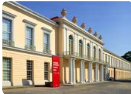
THE JEWISH MUSEUM, BERLIN, ARCHITECT: DANIEL LIBESKIND © BERLIN, BRANDENBURG, WOLFGANG PANDER ©